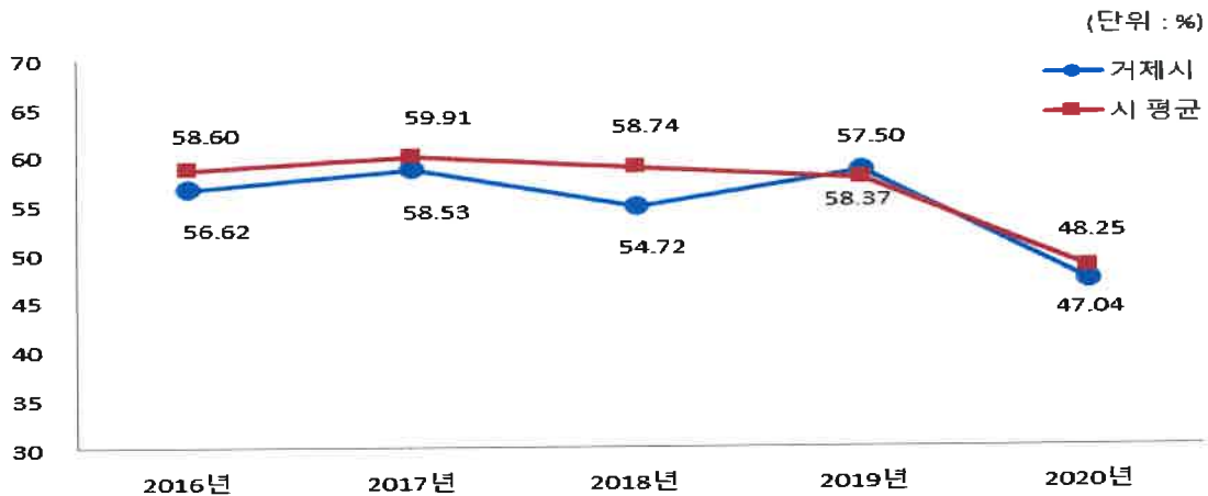
유형 지방자치단체와 재정자주도 비교

☞ 우리 시의 2020년 재정자립도는 동종 자치단체에 비해 1.21% 낮습니다. 이는 이전 재원(보조금)에 비해서 자주재원의 상승률이 더 높아 나타나는 현상입니다.